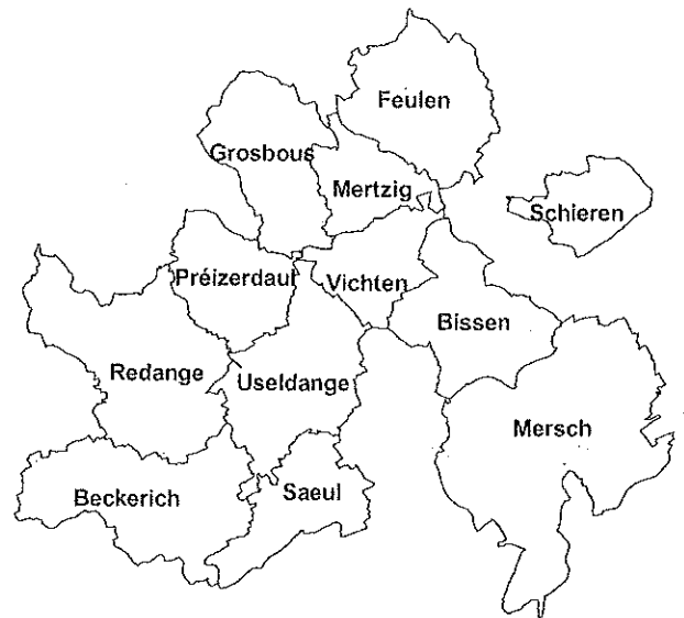
Mitgliedsgemeinden SICONA-Centre Communes membres SICONA-Centre

Ils ont pour but la conservation de la diversité biologique, des habitats naturels et des paysages dans la région, ainsi que la sensibilisation du public pour la protection de la nature.